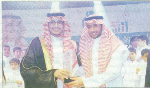
سموه يكرم الذيب

الفرحة العارمة في كل عام حينما نبدأ سوياً مع إنسان بالتحضير لهذا الاحتفال والكرنفال الإنساني الرائع. الجدير بالذكر أن عدد المستفيدين من خدمات الجمعية الخيرية لرعاية الأيتام قد تجاوز 40.000 يتيم وبيتمة وأرملة، تقدم لهم الخدمات الصحية والتربية والمادية كافة على مدار العام بكل مهنية وحرفية.