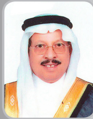
إبراهيم بن محمد بن سعيدان