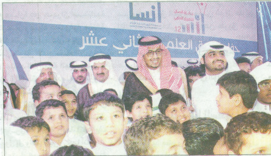
صورة جماعية مع سموه