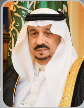
الأمير فيصل بن بندر بن عبدالعزيز رئيس مجلس إدارة الجمعية