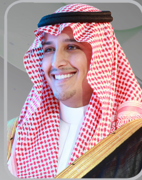
الأمير أحمد بن فهد بن سلمان رئيس اللجنة التنفيذية